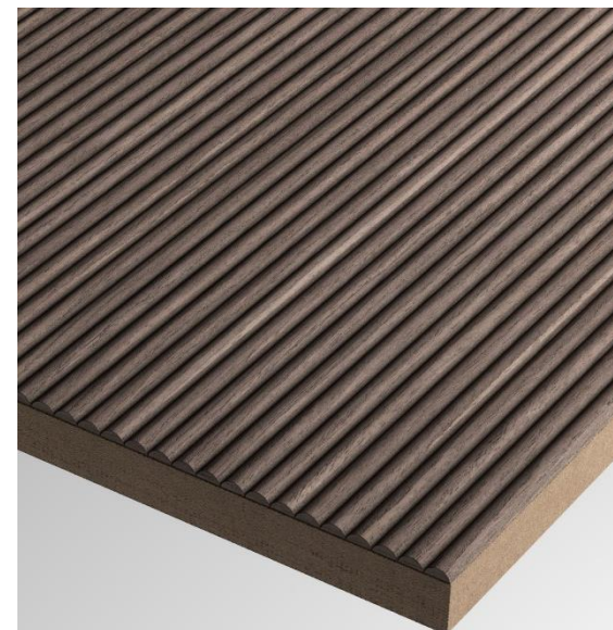
Finitura Noce Canaletto