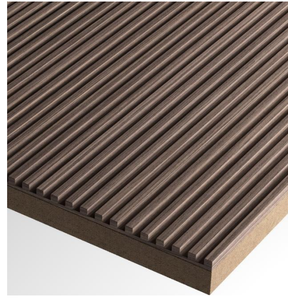
Finitura Noce Canaletto